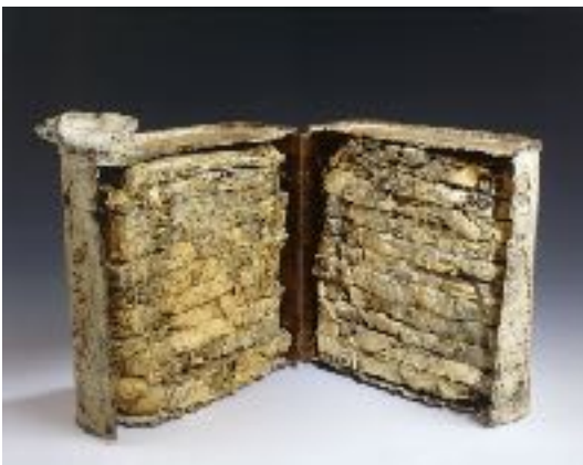
¡Qué lata de libro! Colección