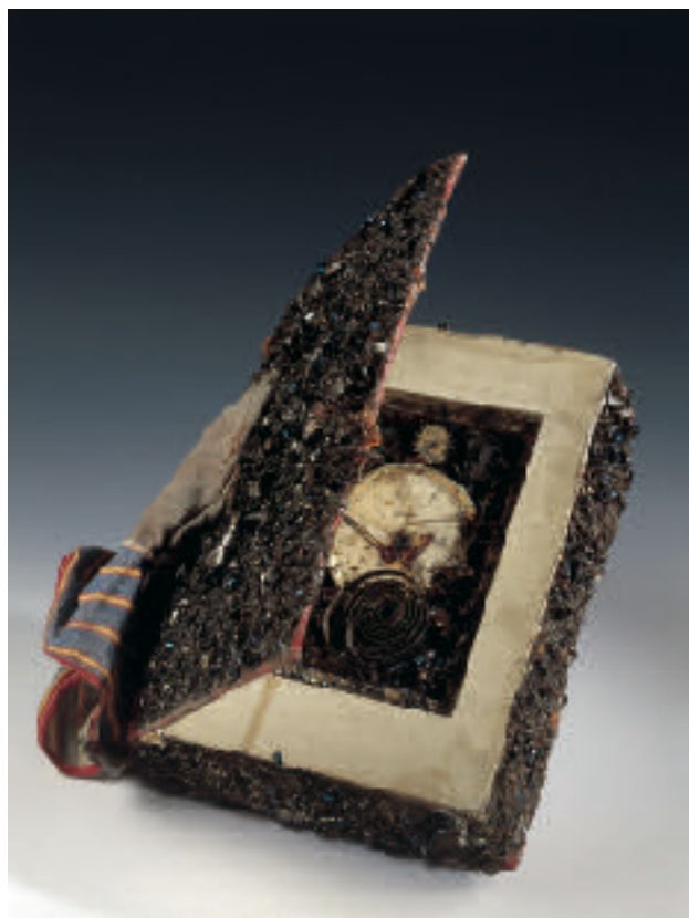
Reloj - Colección Momo

Dentro de esta Biblioteca habitan diferentes proyectos y experiencias, que irán tejiéndose a través de la palabra y el silencio con una fuerte implicación del espectador. Durante 60 minutos iremos conociendo la vida experimentada de un maestro de escuela que intentó narrar el conocimiento y cuyo recuerdo todavía permanece en nosotros.