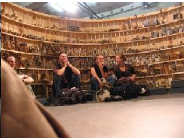
Levende Bibliotheek Anvers (Bélgica) 2005