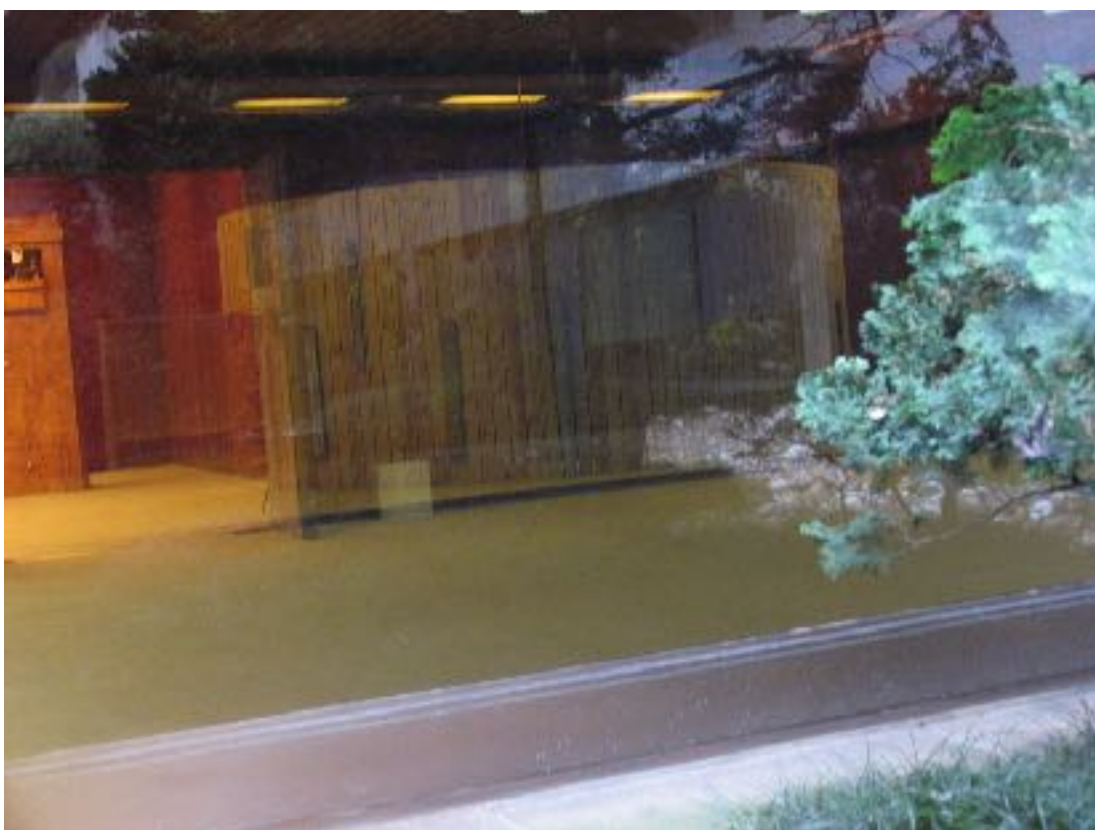
Fundação C. Gubelkian Lisboa 2006