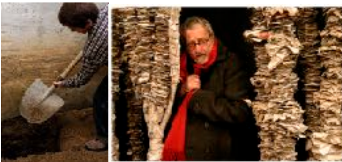
Museo Tiempo Viseu Tanttaka - Albena Teatre “Museo del Tiempo