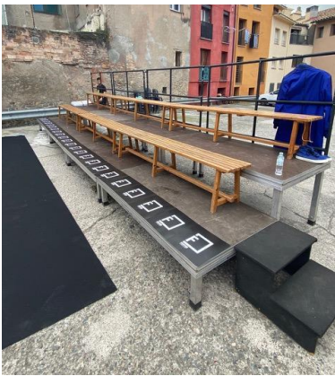
ejemplo 1 - outdoor