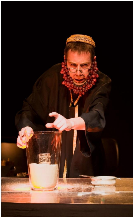
ENTRE DILUVIOS - La Chana Teatro (España) / Festival de Teatro de Bonecos 2007

Enamorados de los objetos más cotidianos e insignificantes, han creado un universo en el que lo popular y lo culto se unen para mostrar un espejo al espectador.