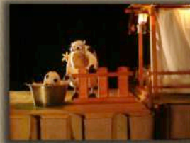
La extraordinaria historia de la vaca Margarita de Títeres Caracartón